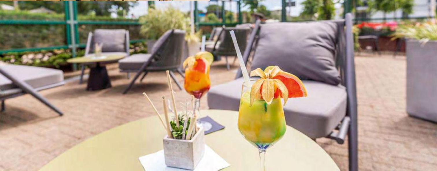
Hausgemachte Cocktails auf der Terrasse