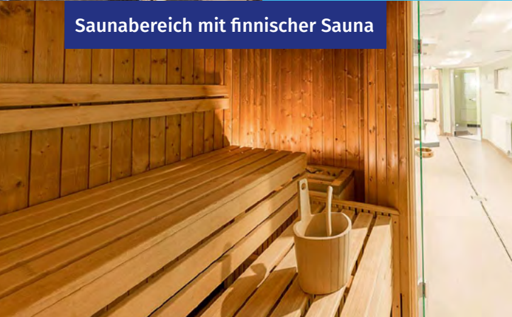
Saunabereich mit finnischer Sauna