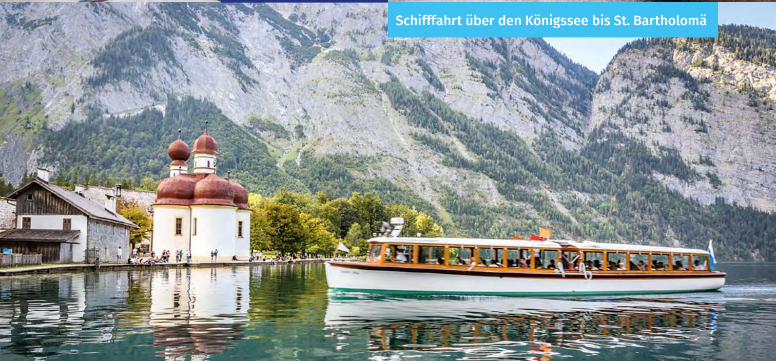
Schiffahrt über den Königssee bis St. Bartholomä