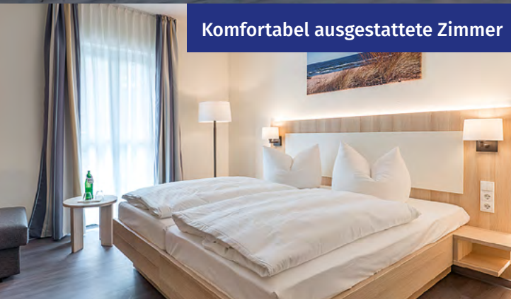
Komfortabel ausgestattete Zimmer