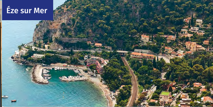
Éze sur Mer