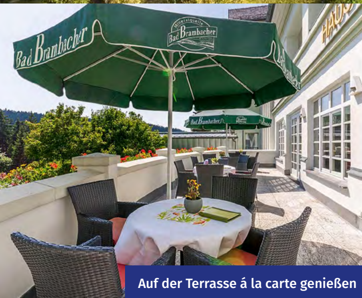
Auf der Terrasse à la carte genießen