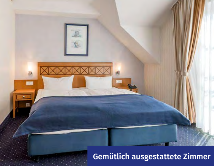
Gemütlich ausgestattete Zimmer