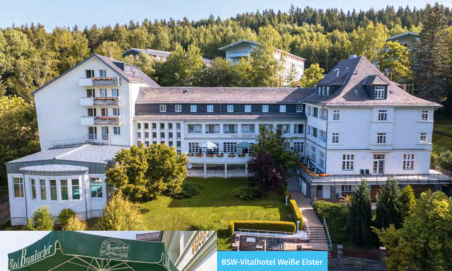
BSW-Vitalhotel Weiße Elster