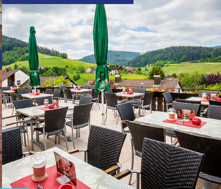
Bei Kaffee und Kuchen die schöne Aussicht auf der Terrasse genießen