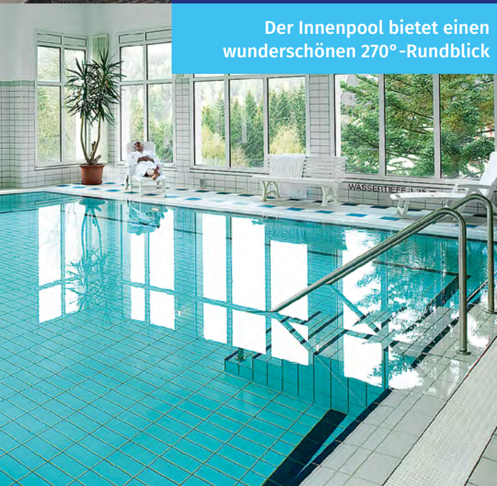
Der Innenpool bietet einen wunderschönen 270°-Rundblick