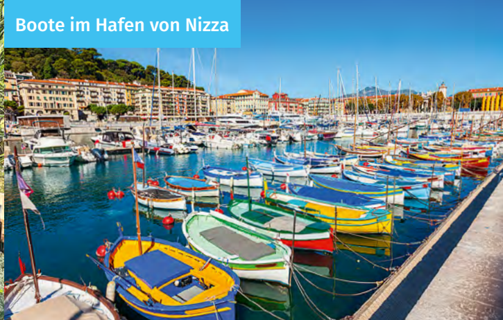
Boote im Hafen von Nizza