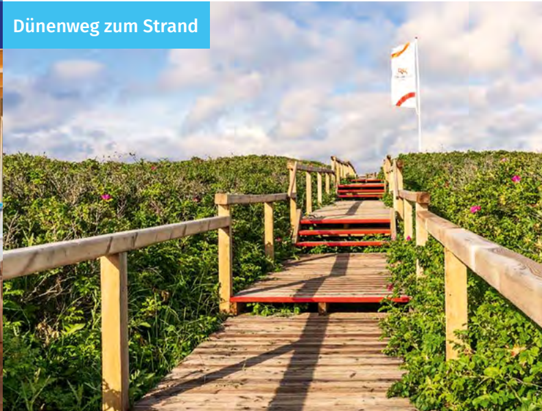
Dünenweg zum Strand