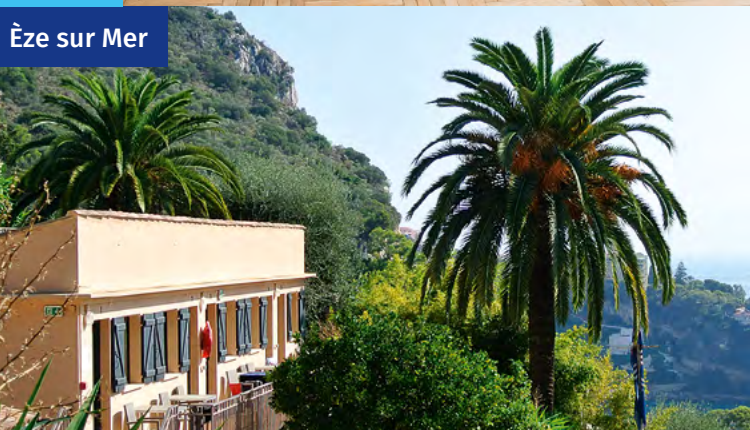
Èze sur Mer