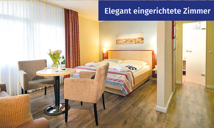
Elegant eingerichtete Zimmer