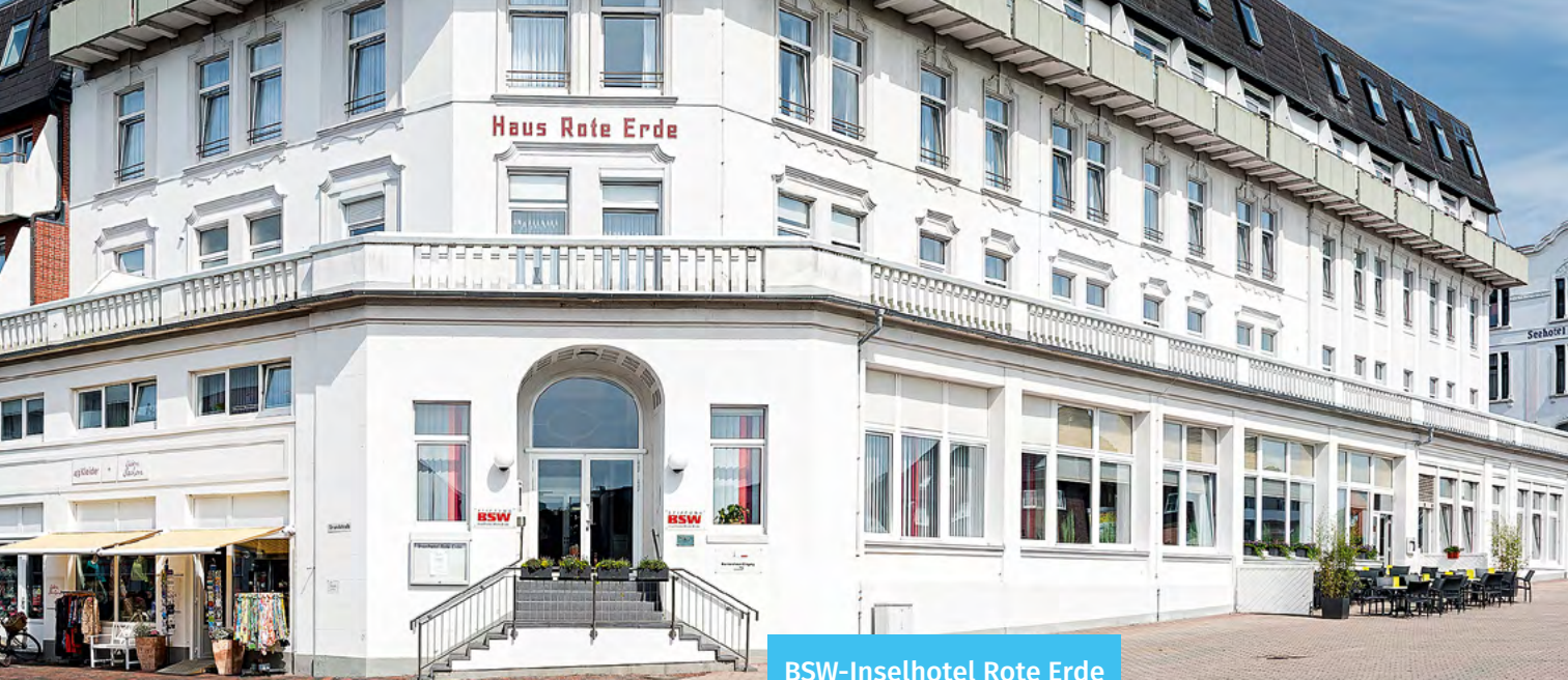
BSW-Inselhotel Rote Erde