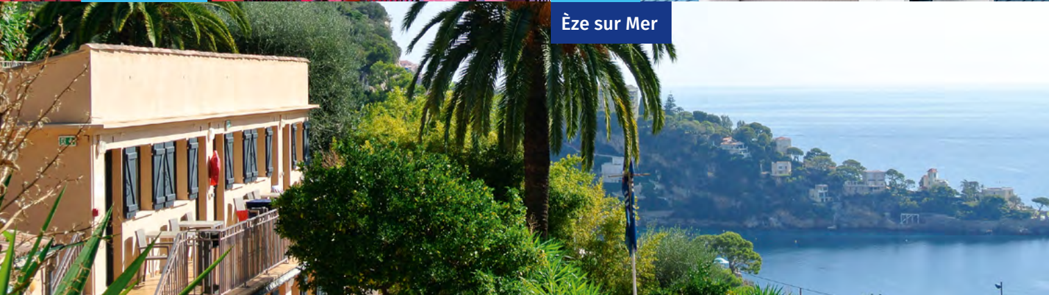
Èze sur Mer