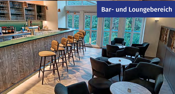
Bar- und Loungebereich