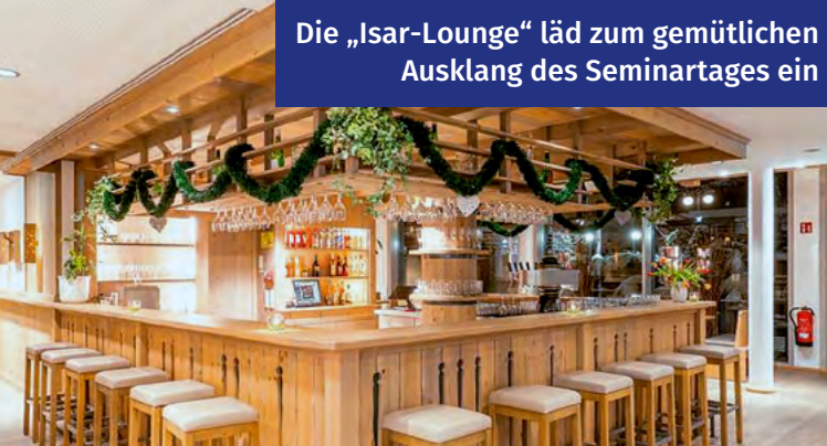
Die „Isar-Lounge“ lädt zum gemütlichen Ausklang des Semintartages ein