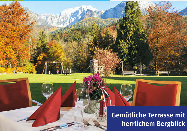
Gemütliche Terrasse mit herrlichem Bergblick