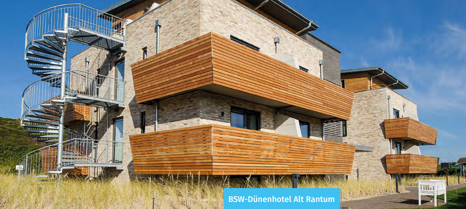
BSW-Dünenhotel Alt Rantum