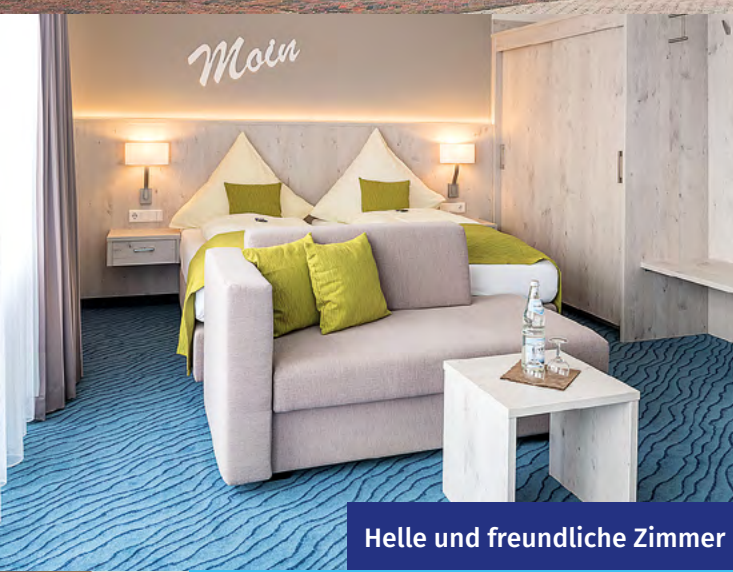
Helle und freundliche Zimmer