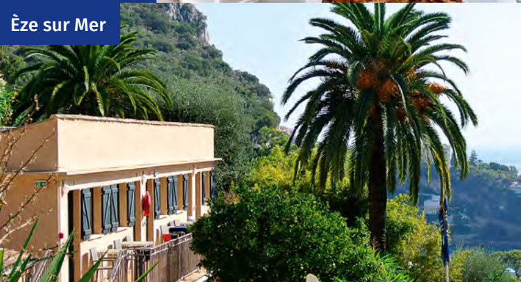
Èze sur Mer